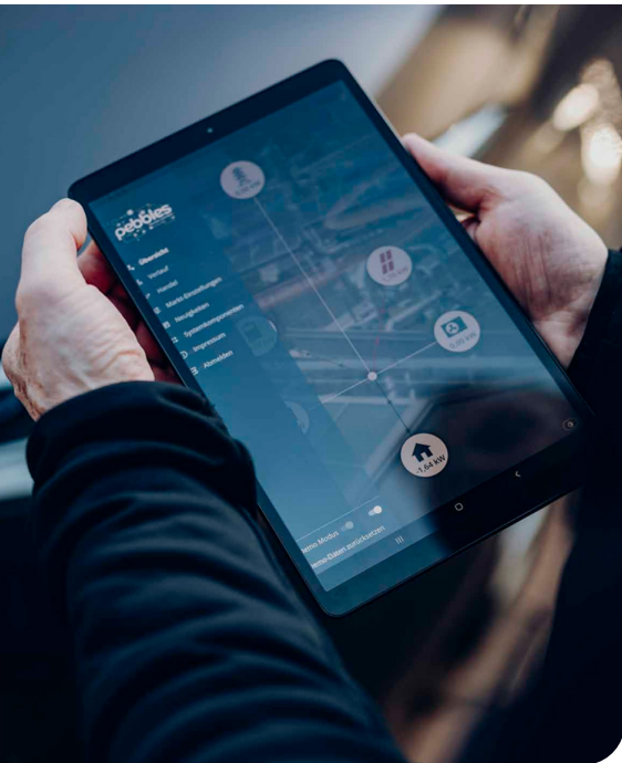
Abb. 2 | App des Projektes pebbles für Teilnehmer:innen zur Festlegung ihrer Handelspräferenzen und Visualisierung von Energie- und Finanzflüssen.

Ein weiterer gesamtgesellschaftlicher Vorteil ist die Steigerung der Resilienz des Energiesystems, die durch eine erhöhte lokale Deckung des Stromverbrauchs erreicht werden kann. Diese wird durch einen verstärkten lastnahen Zubau von Erzeugungs-Anlagen und Speichern erreicht. Im Falle überregionaler Netzausfälle sind diese (Netz-) Regionen dann eher in der Lage – zumindest zeitlich befristet – in einem isolierten Zustand weiter betrieben zu werden. Gut beschrieben sind diese Mechanismen in den Konzeptpapieren des Fachausschusses „Zellulare Energiesysteme“ des VDE 6 .